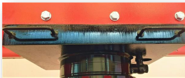
Particolare dei maniglioni di traslazione cilindro